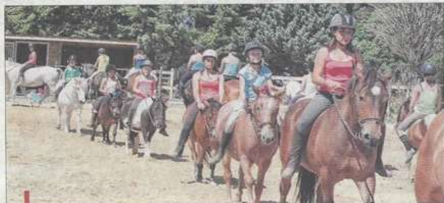
La parade avec tous les chevaux.