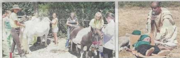
Avant le spectacle, chevaux et enfants se font une beauté. Qui est le plus heureux ?

Tout l'été, il est possible de faire des randos, des stages; contact ☎ 06 74 45 01 49 et ☎ 06 89 09 70 55.