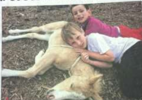
Dream, le jeune poulain, interfun, 4 ans, et Amara, 8 ans, présenteront un spectacle, dimanche, à l'occasion de la journée portes ouvertes du Lucky Horse.